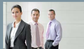
Sales & Customer Care